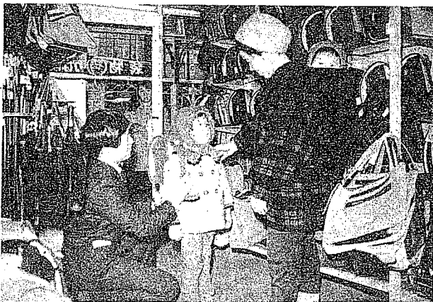
おかあさんといっしょに入学前の楽しい買い物