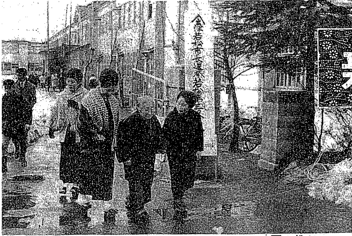
おとしりの方も、家族に手をひかれて、一票を投じました(三中会場で)