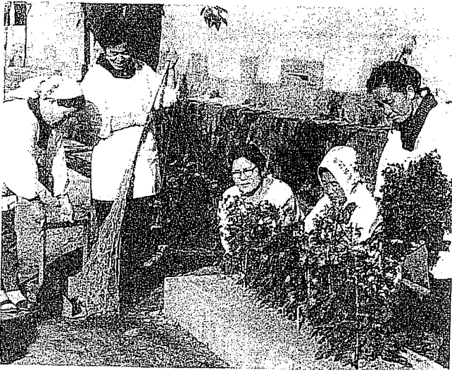
追手門通りの花壇を手入れする会員のみなさん