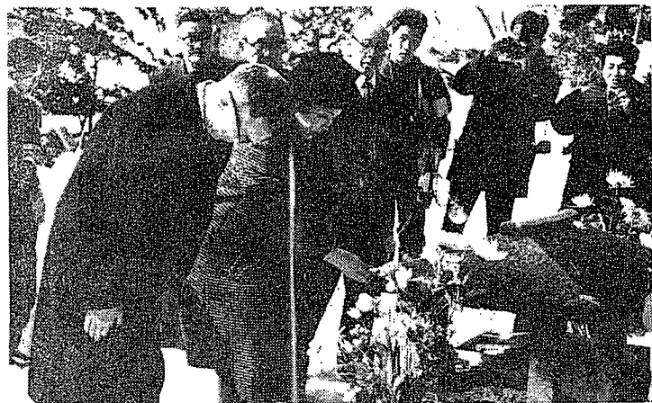
白虎隊士の墓を詣でるライシャワー大使夫妻

「天守閣は九月に完成し、もう一度おいでください」と訪れたいと語るなど、歴史と観光の町会津に誇りを感じ、日本の歴史と文化に関する研究