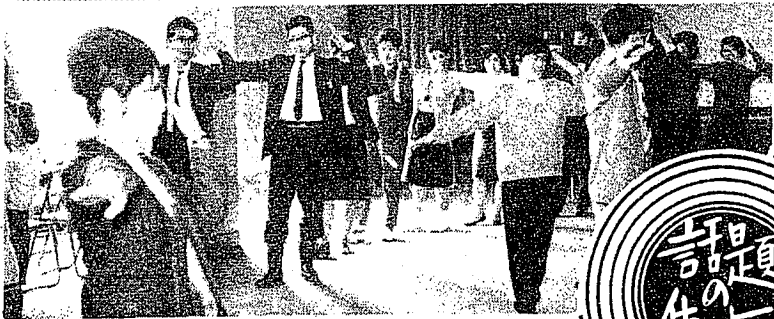
全国表彰に輝く日新小少年消防クラブ

日新小少年消防クラブは5日、優良クラブとして県下でただ1校、全国消防クラブ運営協議会長賞を贈られた。同クラブは35年5月に発足、クラブ員の6年生男女40人は毎月1回消防器や家庭の防火など、火の正しい取り扱いを勉強している。5日にはクラブ代表が東京消防会館の授賞式で盾を受けたが、学校では火事のない街づくりに一層の努力を続けている。