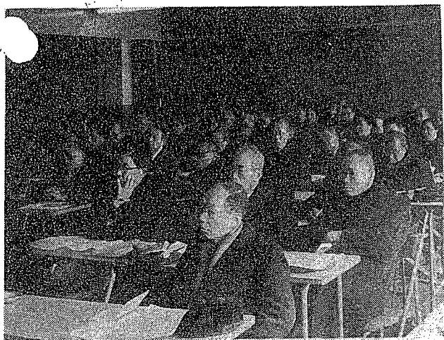
(写真…悪書追放運動対策懇談会)

良出版物を、店頭からなくす。書籍店などと話し合いを持ち、不良出版物を販売しないようにして頂くと共に、成人コーナーなどを設ける方法などを取上げて頂く。成人コーナーへは青少年が立ち入らないようにする。成人コーナーへは青少年が立ち入らないようにする。成人コーナーへは青少年が立ち入らないようにする。