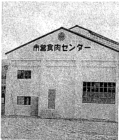
市営食肉センター

家畜の普及振興を計ってま市いいでいます。農政課は、昨年からの食肉センター、年々、家畜は普及して、今までの建設を進めてきました。その工に、市で貸し付けた家畜は、約三事の大部分が、最後の仕上げを急〇〇頭にも達しました。このよう