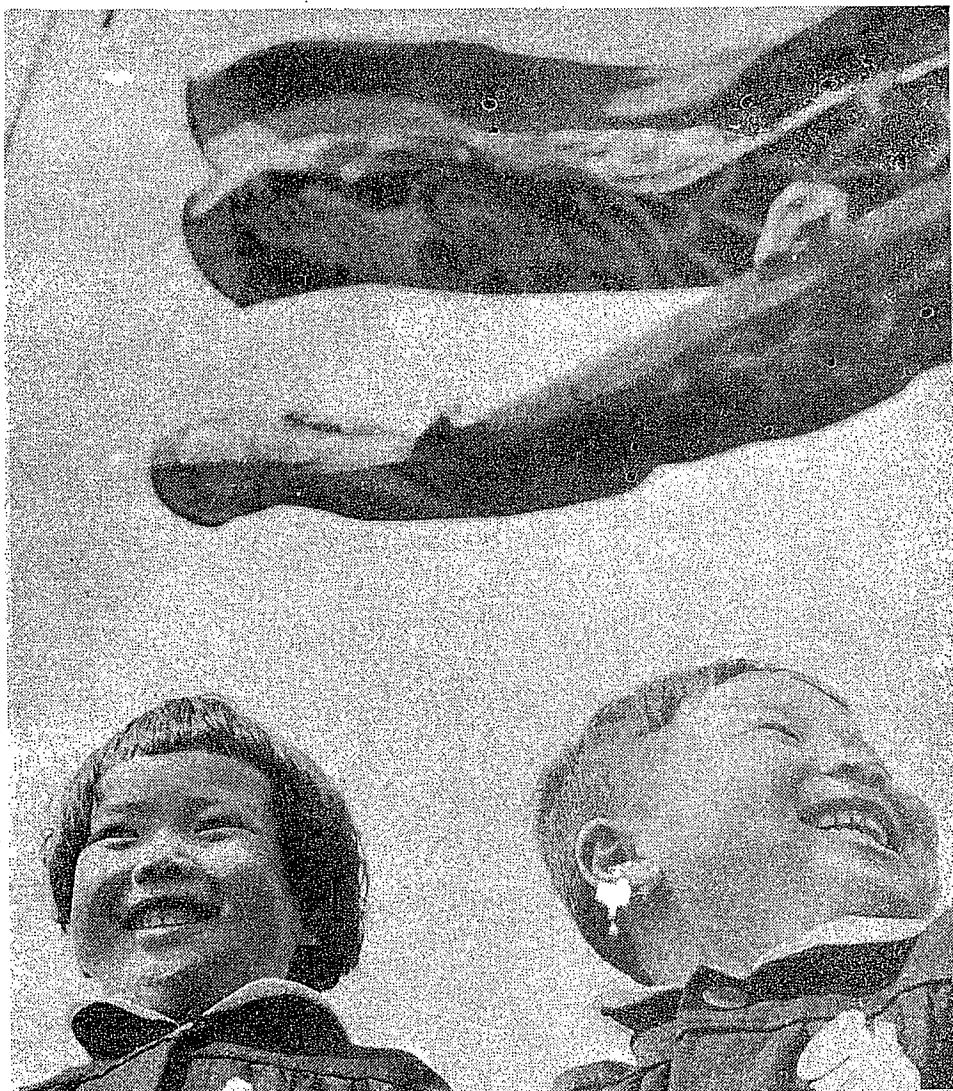
— 慈光幼稚園で —

風かおる はためく こいのぼりの下で 僕と私のひなんだ 晴れやかな笑顔で おどける 子供達にも 快よい春の風が いっぱいに ゆらぐ