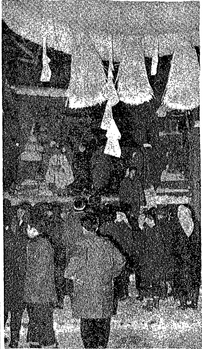
羽黒山の曉参り 近年珍らしい元旦の大雪に、会津の老若男女、めぐりぐる新年を寿ぎ、身も心も清め参拜。 その数五万人に上る。今年もどうか国も市も家々も揃って平安大吉に過したいものです。

昭和36年度の評価額を決定する償却資産の申告は、もうお済みになったでしょうか。この申告については、法で申告の義務がはっきり定められておられますので、まだお済みになっておられない方は、次の要領により、期限日(1月31日)まで必ず申告して下さい。 ●新物品価格三万円以上のも この月末日まで申告 この申告は1月1日現在事業用資産を所有している方に1月31日迄申告していただきます。 ①これは新物品価格にして一個又は一組三万円以上と認められるものについて記載していただきます。 ②申告用紙は次の二種類に分けてあります。 ●償却資産申告書 この申告書には資産の所有者の住所氏名、及び所在地、住所などのほか、種類別明細書 ●帳簿価格 法人税法又は所得税法の規定による所得の計算上、損金、又は必要経費として控除すべき減価償却額、又は減価償却費の計算の基礎となる価格を記載すること。 ●この明細書には昭和36年1月1日現在所有の資産の個々の種類、数量、取得の時期、その他償却資産の価格の決定に必要な事項を記載して下さい。 ●資産の区分 各欄とも具体的に記載して下さい。特に資産の名称、型式、規格に於ける記号、作業能力を端的に表現する尺度、重量、容積、又は馬力等、なお、自家製作でない場合は必ず製造会社名を記載して下さい。 ●取得の時期 資産を取得した時期(不明なものも推定時期)を記載して下さい。 ●取得価格 取得価格 ●償却資産申告書 この申告書には資産の所有者の住所氏名、及び所在地、住所などのほか、種類別明細書 ●帳簿価格 法人税法又は所得税法の規定による所得の計算上、損金、又は必要経費として控除すべき減価償却額、又は減価償却費の計算の基礎となる価格を記載すること。 ●この明細書には昭和36年1月1日現在所有の資産の個々の種類、数量、取得の時期、その他償却資産の価格の決定に必要な事項を記載して下さい。 ●資産の区分 各欄とも具体的に記載して下さい。特に資産の名称、型式、規格に於ける記号、作業能力を端的に表現する尺度、重量、容積、又は馬力等、なお、自家製作でない場合は必ず製造会社名を記載して下さい。 ●取得の時期 資産を取得した時期(不明なものも推定時期)を記載して下さい。 ●取得価格 取得価格 ●償却資産申告書 この申告書には資産の所有者の住所氏名、及び所在地、住所などのほか、種類別明細書