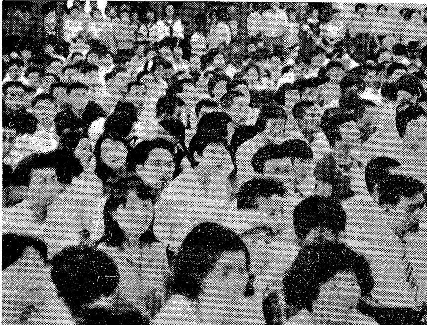
(写真は市政公聴会に集つた人々)