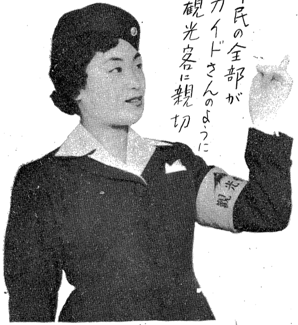
市民の全部が ガイドさんのように 観光客に親切