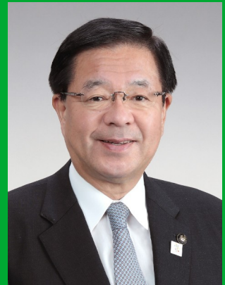
会津若松市長 室井 照平