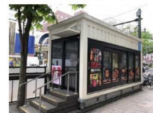
食事施設（すわろうテラス・札幌市）