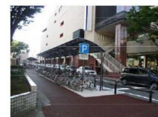
自転車駐輪器具（新潟市）