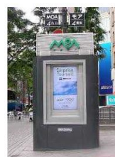
看板（デジタルサイネージ）（新宿区）