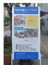
看板（三宮中央通り・神戸市）