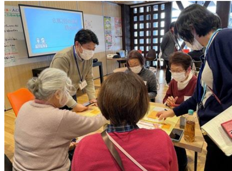
地域通貨会津コイン説明会（決済WG）