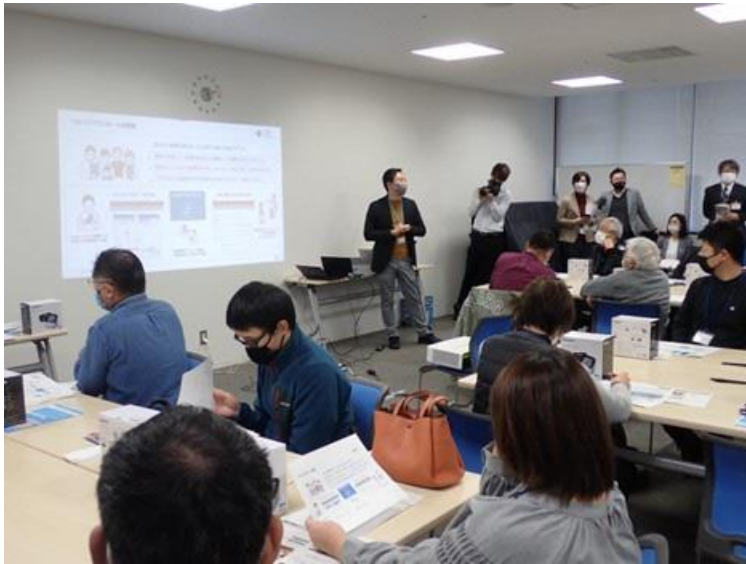
血圧ケア体験会（ヘルスケアWG）