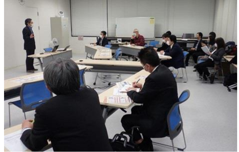
医療者向け説明会（ヘルスケアWG）