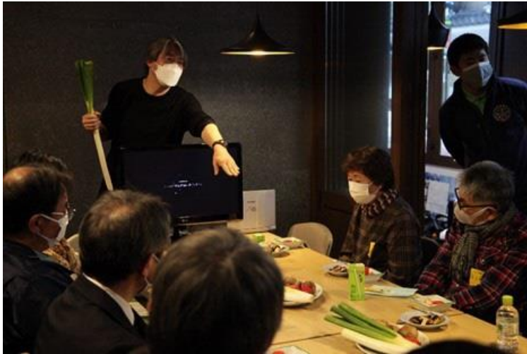
ジモノミツケ試食会（食農WG）