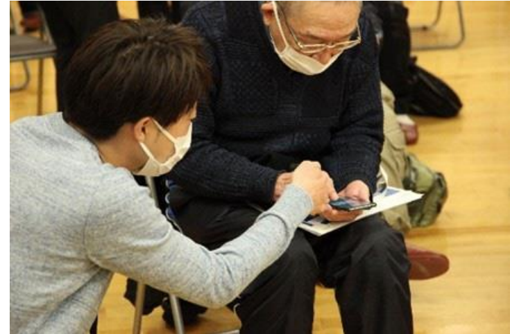
旧年貢町内会・天神町内会 合同防災集会（防災WG）