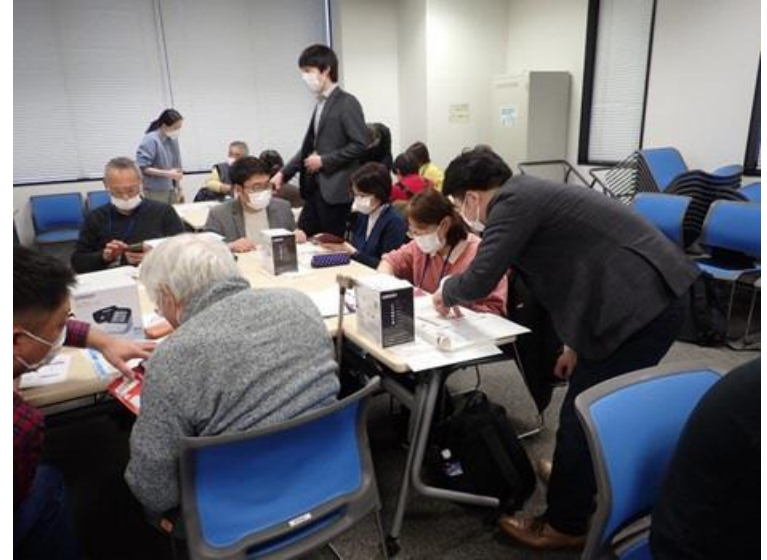
血圧ケア体験会（ヘルスケアWG）