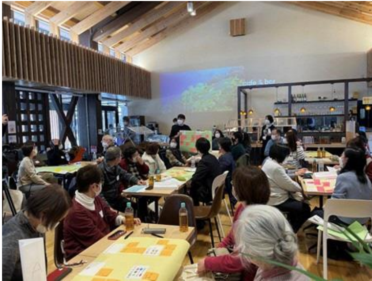
地域通貨会津コイン説明会（決済WG）