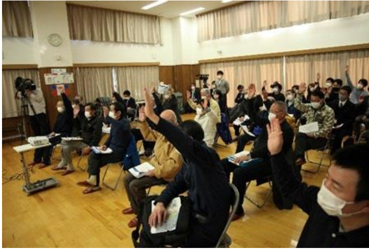
旧年貢町内会・天神町内会 合同防災集会（防災WG）