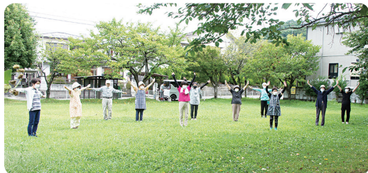
感染予防のため間隔を取っての活動

若松第1地域包括支援センター（担当：行仁小・鶴城小・東山小学校区）では、コロナ禍において高齢者の在宅時間が増えたことによる体力や認知機能の低下を防ぐことを目的に、感染予防をしながら集える場として、屋外でラジオ体操を行う「青空介護予防教室」を始めました。