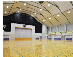
フィットネスルーム