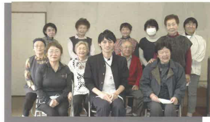
活動場所：高塚公民館(河東町) 活動内容：いきいき百歳体操 日時：毎週木曜日 9:30～10:30

活動の時、一番後ろからみんなの様子を見ていたら、2、3回目の活動の頃から手がピンと伸びて、体の動きがすごくきれいになりました。 みんな体も動きも軽くなって、始めて良かったなあと思いました。