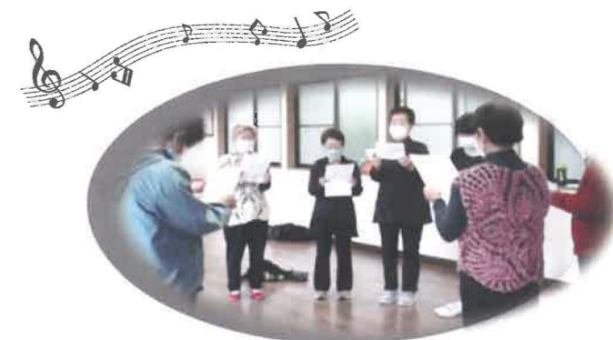
活動の最後に会津若松市民の歌を歌って楽しく活動しています。