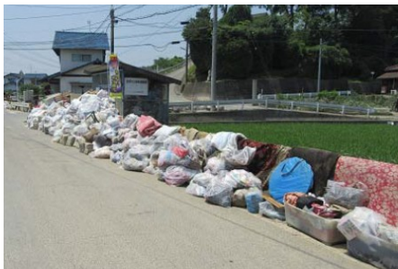
バス停及び道路への仮置き