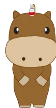
会津若松市ユニバーサルデザインキャラクター 「ゆにぼくん」