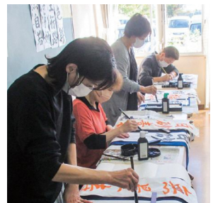
書道教室の様子 (悠遊倶楽部)