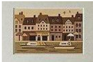
木はり絵イメージ ※紙のように薄くスライスした天然の国産の木を使ってつくるはり絵です。(てわっさ教室)

▽費用：材料費等の実費負担あり ▽豊コースターは須賀川まで公民館バスで移動し1日の日程になります。