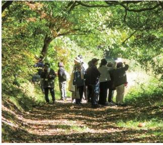
下野街道「氷玉峠」にて(まち歩き あいづ五街道)