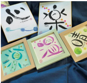
筆絵イメージ (てわっさ教室)