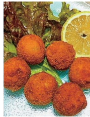
スリランカ編カトウレットを作りました!(食のワールドツアー)

▽受講申込は7月に行います。河公だより7月号又は河東公民館へお問い合わせください。