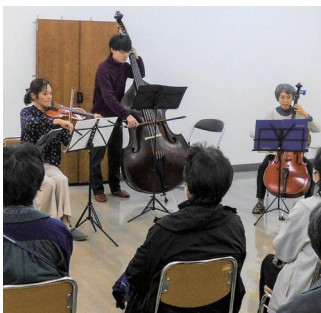
オータムミニコンサート