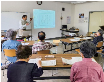
季語って難しい (通信俳句講座初回講義)