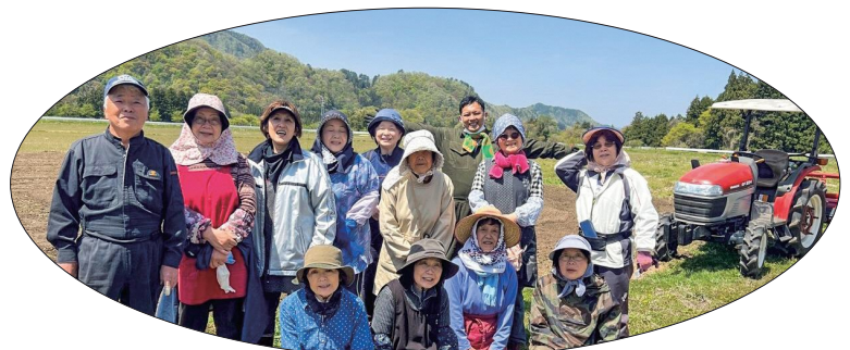
ハックルベリーと大根を作っています (大戸まちづくり協議会の畑にて)