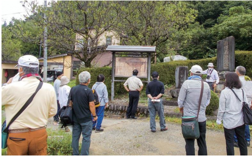
先人に思いをはせて (大戸の歴史講座)