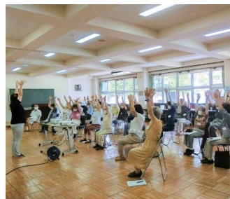
軽体操で体をほぐします! (ふれあうよろずカフェ)

▽対象…成人 ▽期間…5月～3月 14回 主に火曜日午前と他に金曜日の回あり ▽内容…軽体操、健康講座、eスポーツものづくり、移動学習など ▽費用…金曜日の回は、実費負担あり