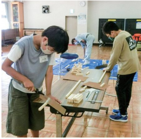
木工クラフトづくりに挑戦 (みなこー夢広場)

▽内容…木工クラフト、昔玩具作り体験、押花アート体験、お菓子教室、門田地区文化祭参加などを予定しています。