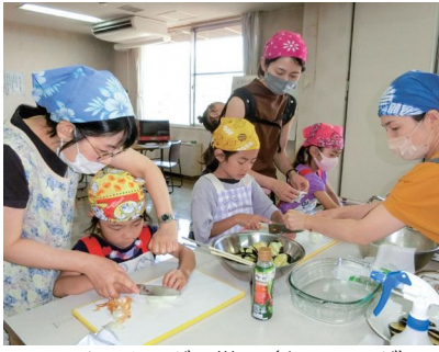
エコクッキングの様子 (私のサラダ)