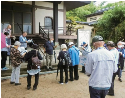
善龍寺にて (門田町再発見)

住み慣れた町の魅力を再発見する講座です。地域の産業や歴史などを学びながら、新たな感動に