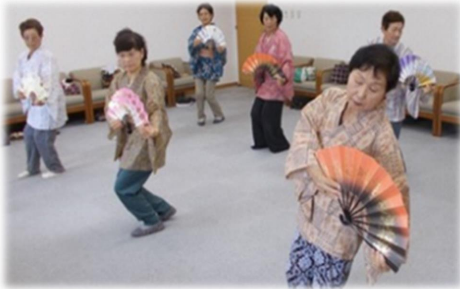
例1：支所の会議室で公民館活動を実施（北会津地区）

すでに取組が行われている地区では次のような取組を実施 (既存の施設の使い方を見直し、地域の活動や活性化の取組へ活用)