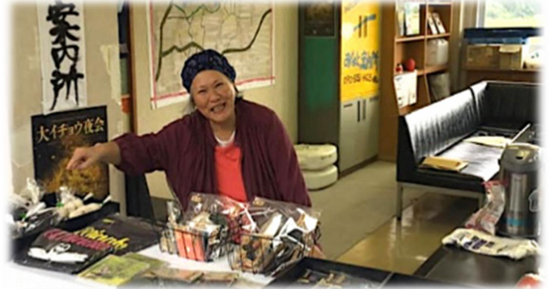
例2：公共施設（基幹集落センター）で地域の案内所を運営（湊地区）