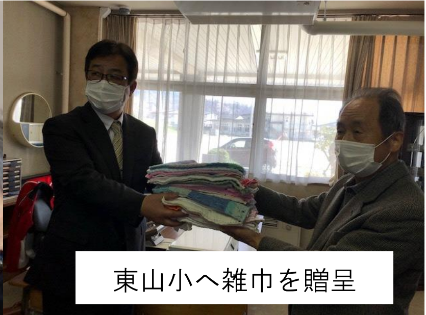
東山小へ雑巾を贈呈