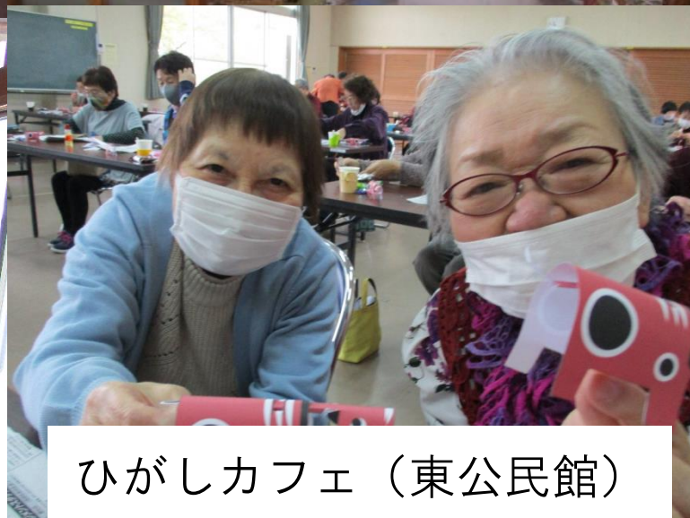
ひがしカフェ（東公民館）