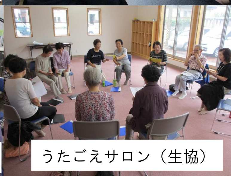
うたごえサロン（生協）