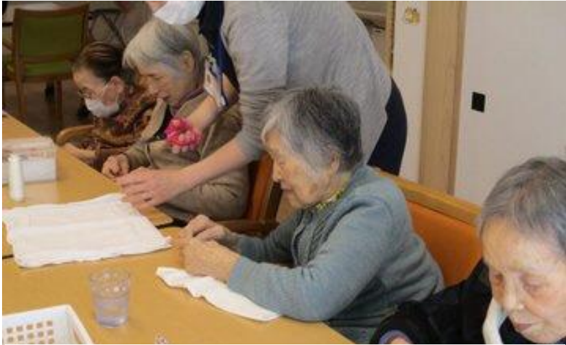
雑巾を縫うけいざんホームの皆さん