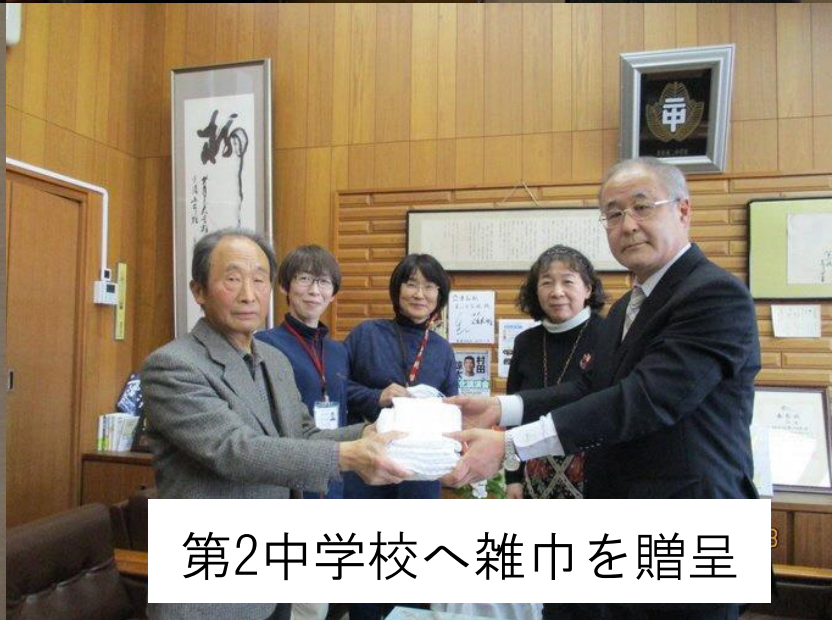
第2中学校へ雑巾を贈呈