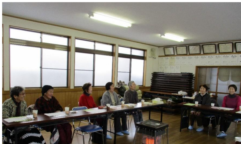
おしゃべりサロン（飯盛山団地）