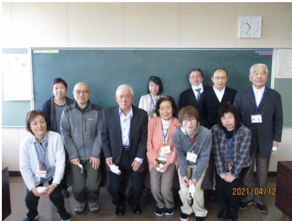
朝日ヶ丘町内会ミニケア会議