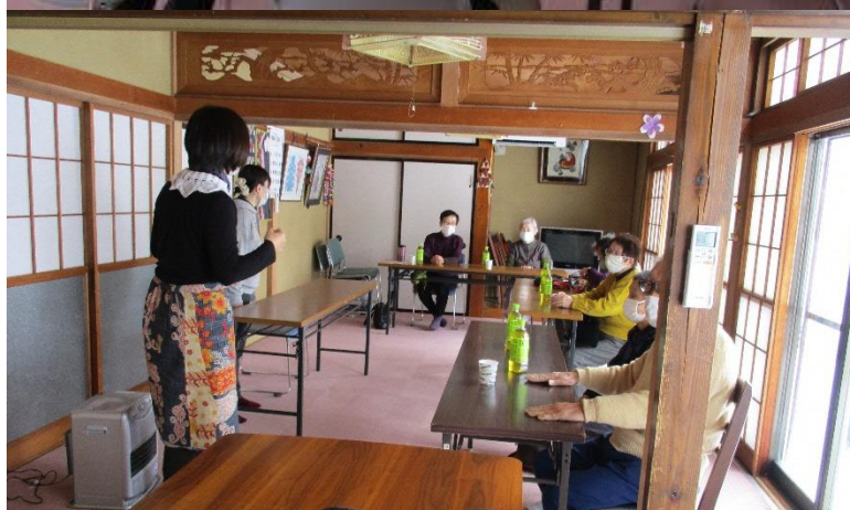
オレンジカフェ メモリィ（生協）