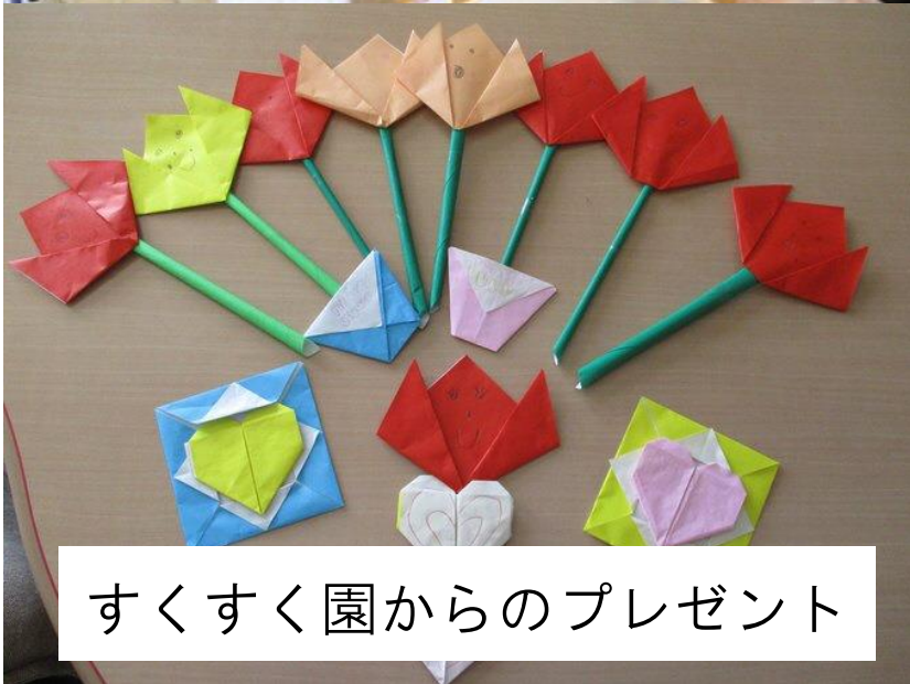
すくすく園からのプレゼント