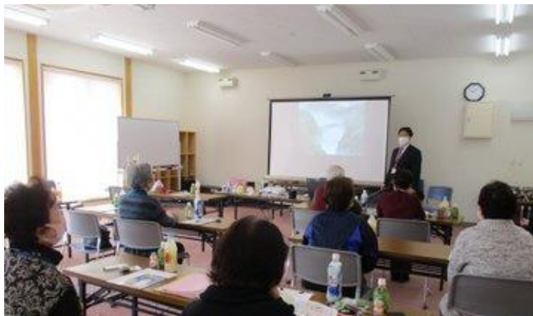
千石サロン(ニュータウン)