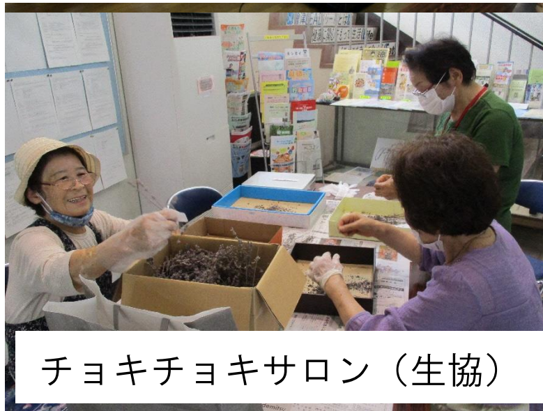
ちヨキちヨキサロン（生協）