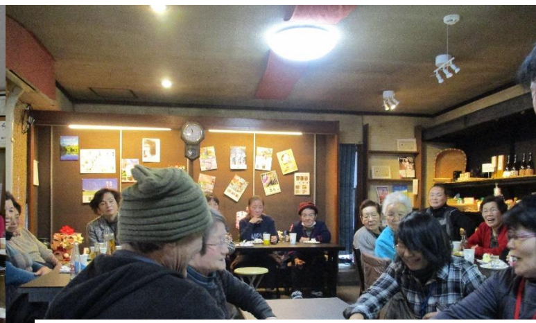
湯けむりサロン（湯本）