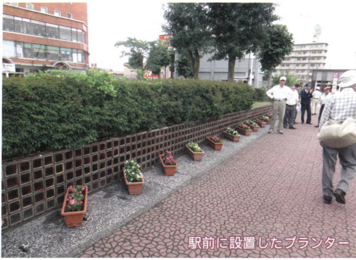
駅前に設置したプランター

会津若松駅前前の歩道に、ベゴニアのプランターの設置を、市民憲章推進委員と駅職員・東日本旅客鉄道OB会の方々のご協力をいただき、6月24日に行いました。プランター設置の前に、雑草やゴミ拾いを行い一段と花が美しく見えるよう皆さんで行いました。 会津の玄関口である会津若松駅をきれいな花で飾ること、観光客の皆様や駅を利用さ