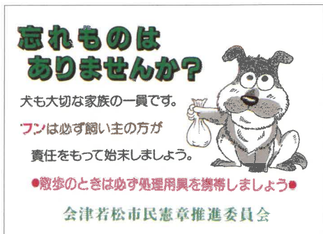
啓発シール(A4サイズ)

「無理をしない」、「無駄をしない」、「見栄を張らない」の三ないを合い言葉に、この簡素化運動を進めていきましょう。