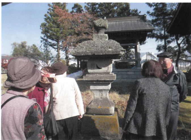
会津三十三観音めぐり

市民憲章推進委員会では「自然と文化財とを愛しゆかしいまちをつくりましよう」、「教養を高め文化のまちをつくりましよう」の条文をもとに、毎年、文化財研修会を実施しています。今年度は、参加者13名で新たに日本遺産となった「会津三十三観音めぐり」をテーマに、一番札所大木観音から十番札所勝常観音まで10ヶ所の観音堂を参拝し、ご詠歌のうたよみと、そこに