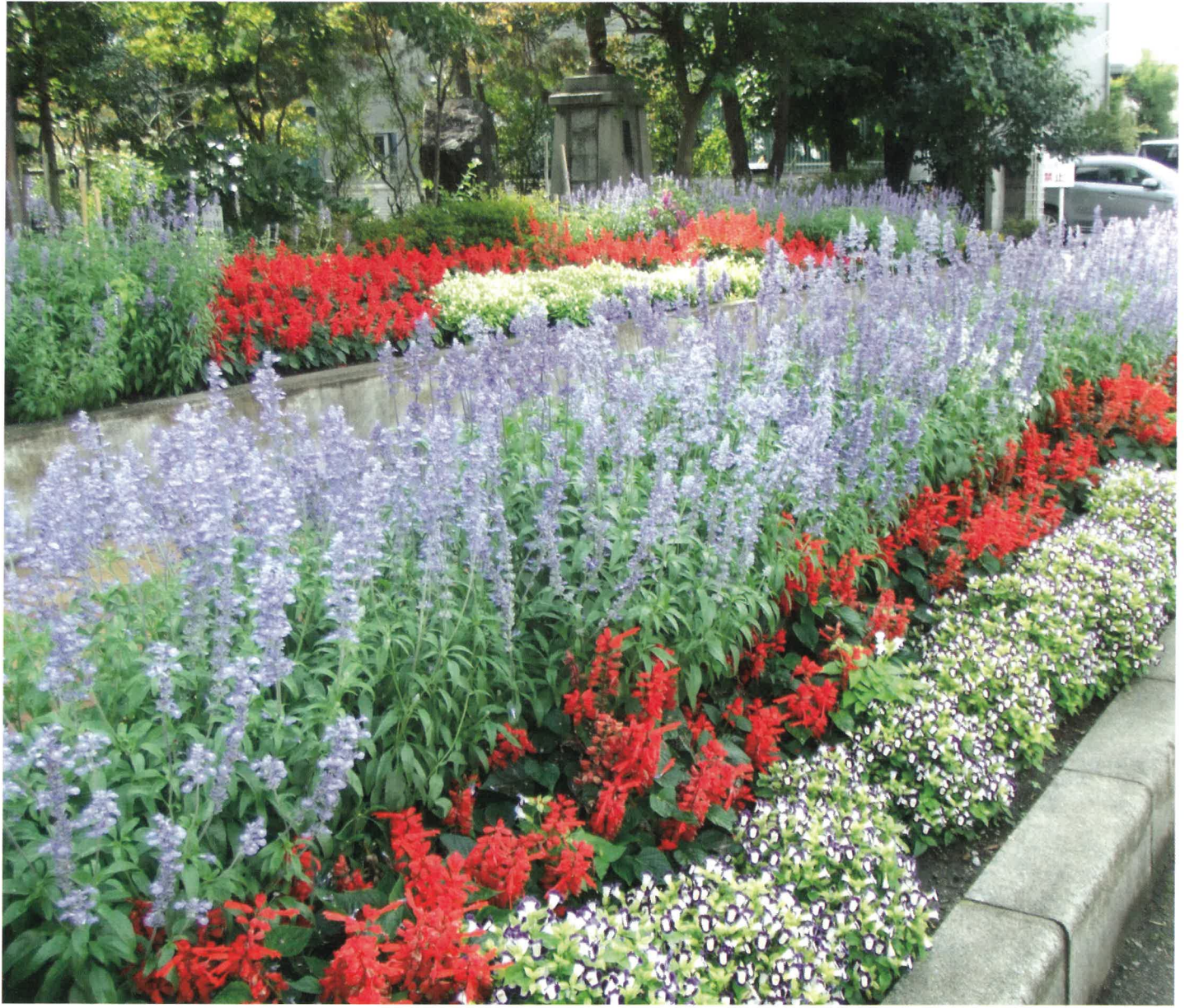
(会津若松市立謹教小学校の花壇)