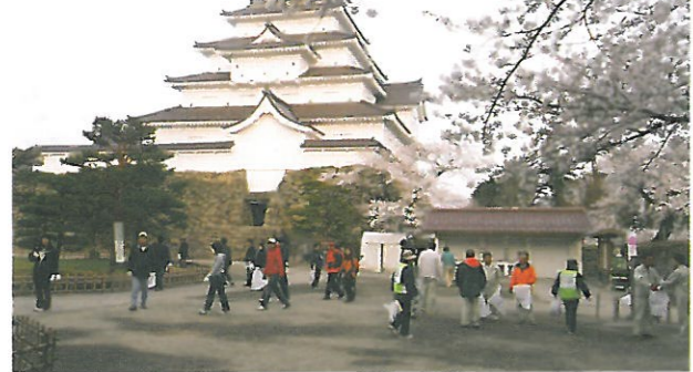
鶴ヶ城をきれいに

春の観光シーズンを迎えるにあたり、平成25年4月20日(土)に鶴ヶ城公園で約1,000名の方々に参加をいただき、環境美化活動「クリーン鶴ヶ城作戦」を行いました。