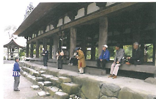
新宮熊野神社「長床」

熊野神社のボランティアガイドや願成寺の係りの方に案内をして頂きました。自然の中にたまたま歴史の建造物は貴重ですから大切に保護して行きたいです。永年維持管理をして下さった方々に心より感謝致します。当日は、皆