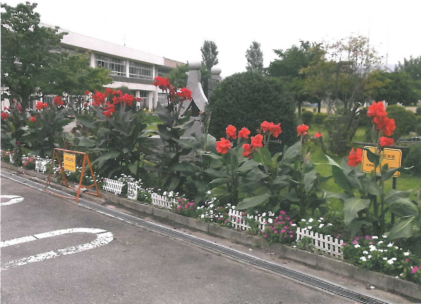
(会津若松市立川南小学校)