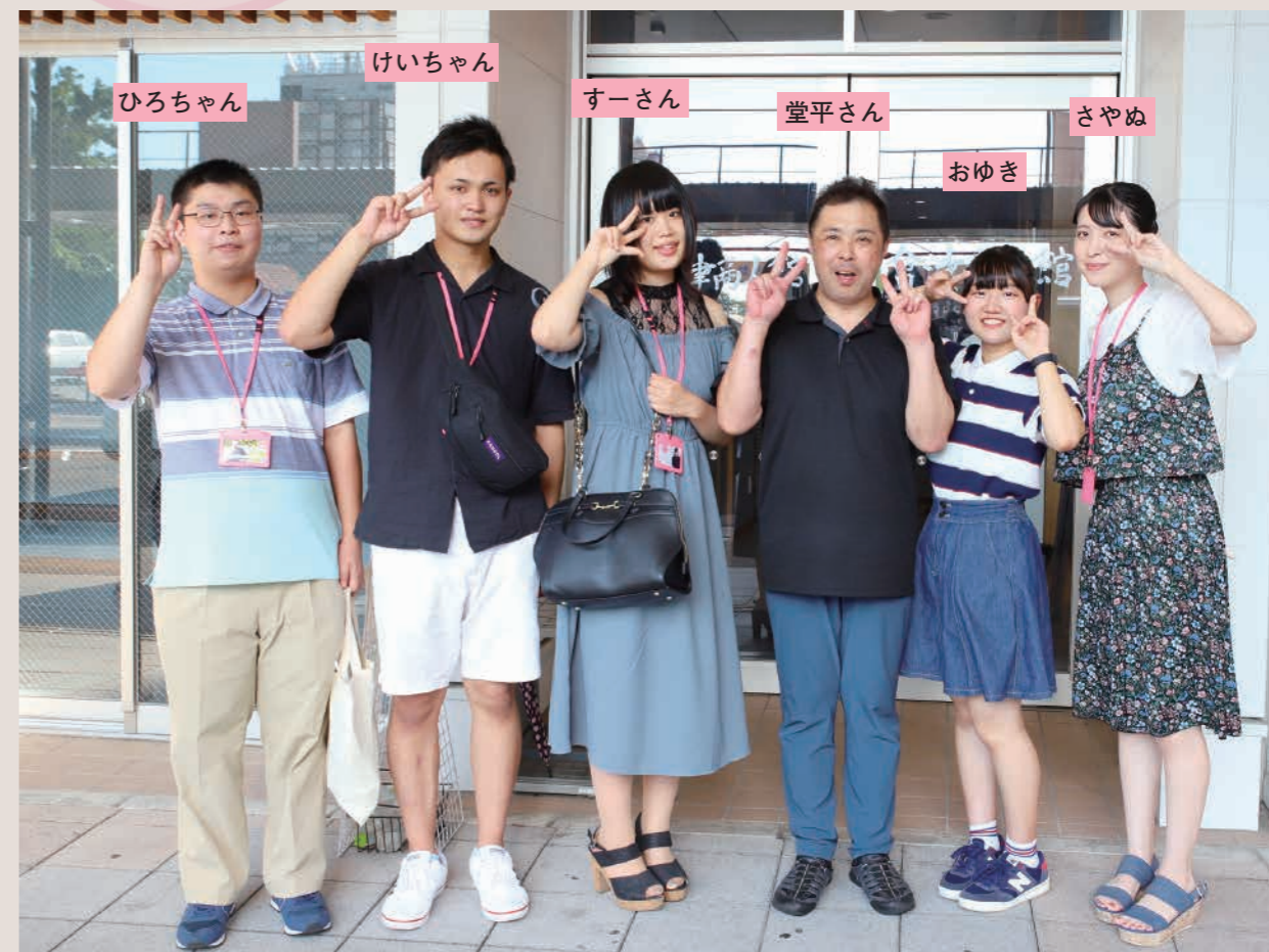
頑張って商品開発をしています。応援お願いします！

学生PR部「AiZ'Sモーション」は、神明通り商店街の皆さんと一緒に、会津伝統のオタネニンジンを使った商品開発をしています。9月19日(土)から21日(月・祝)までの3日間、神明通りで、オタネニンジンを使ったパンを販売します。ぜひ、おいください。