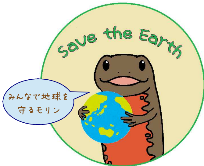
会津若松市 環境PR大使 いいもりん

Think globally, Act locally 地球規模で考え、足元から行動を！