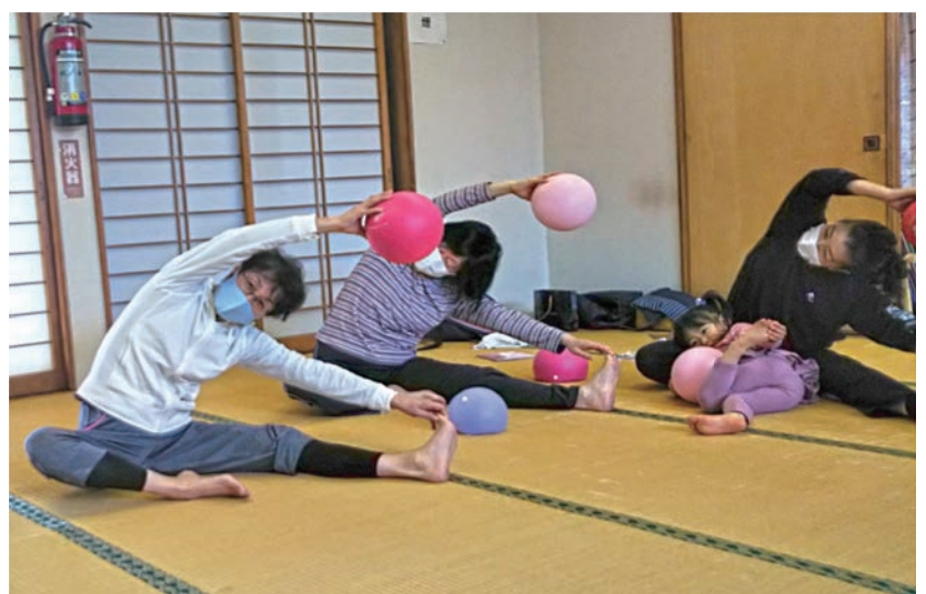
孫も一緒に楽しい健康体操

主な活動として、会話や相談、体操や卓球などのスポーツ、音楽活動、学習活動、花見や芋煮会、旅行など参加する人同士で話し合い、好きな活動を行っています。