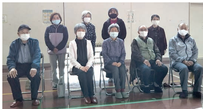
おもしろ会へ参加した皆さん

この日は、2チームに分かれて対戦しました。男性チーム女性チームに分かれたときは、3戦とも女性チームが勝利しました。