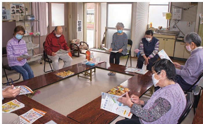
体操の後に健康教室はみんな真剣です