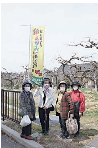
コスモスの皆さん