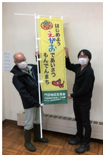
身不知柿ののぼり旗

門田町区長会と養護老人ホーム長寿園、若松第3地域包括支援センターが協力し、あいさつのまちの実現に向け、各町内会や公民館等の関係団体にのぼり旗を設置し、あいさつ活動の啓発を行っています。