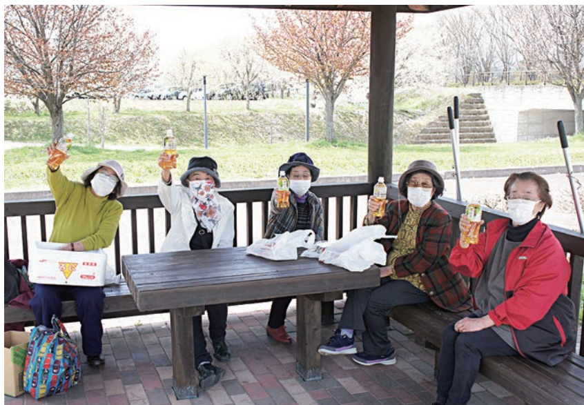
会津総合運動公園のあずまやでかんぱ〜い！