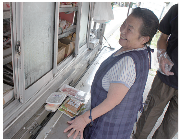
移動販売車により自宅前で買い物ができます