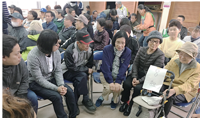
組で集まり避難状況を確認中

近所の人々が顔の見える関係になることで、日常の支え合いだけでなく、災害時の支え合いにつながっています。