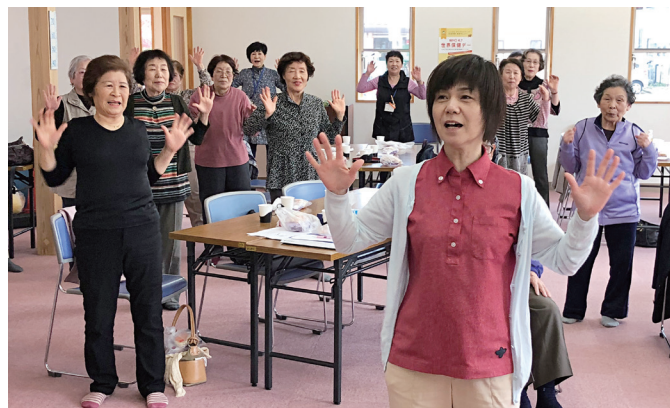
地域サロン「千石秋桜会」

これからは地区社会福祉協議会として、小規模な地域サロンの支援や孤食カフェ「Neccaども」の開催など、これまで地域で取り組んできた高齢者支援活動の充実を図りながら、将来は、子どもや障がいのある人への支援など、活動の幅を広げていきたいとのことです。