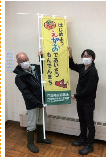
身不知柿ののぼり旗

「うちの地域福祉活動は他の地区に負けない!」、「うちの活動はみんな笑顔だよ」、「こんな問題があったけどみんなで解決したよ」、「うちの施設では町内会等と連携してこんなことをやってるよ」など「ちいきふくし」に載せたい情報がありましたら、地域福祉課や高齢福祉課にご連絡ください。