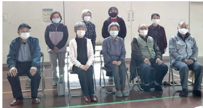
おもしろ会へ参加した皆さん

この日は、2チームに分かれて対戦しました。男性チーム女性チームに分かれたときは、3戦とも女性チームが勝利しました。