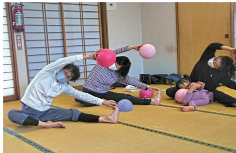
孫も一緒に楽しい健康体操