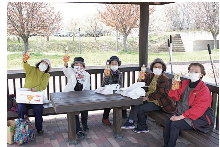
会津総合運動公園のあずまやでかんぱ〜い！