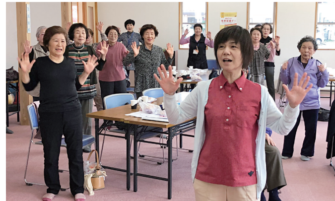
地域サロン「千石秋桜会」

これからは地区社会福祉協議会として、小規模な地域サロンの支援や孤食カフェ「Neccaども」の開催など、これまで地域で取り組んできた高齢者支援活動の充実を図りながら、将来は、子どもや障がいのある人への支援など、活動の幅を広げて行きたいとのこと。