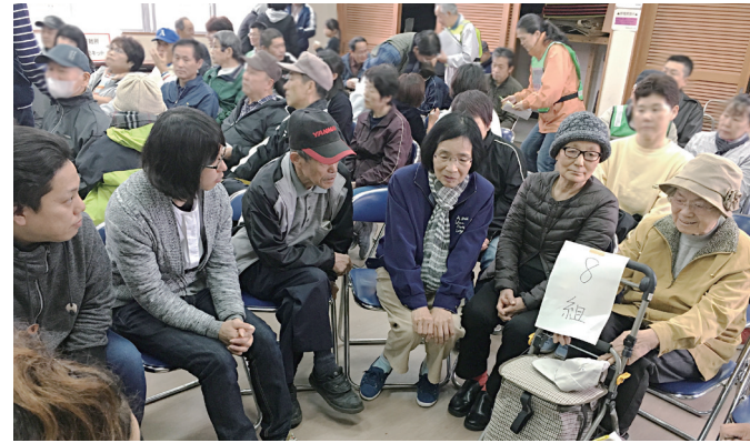
組で集まり避難状況を確認中

近所の人々が顔の見える関係になることで、日常の支え合いだけでなく、災害時の支え合いにつながっています。