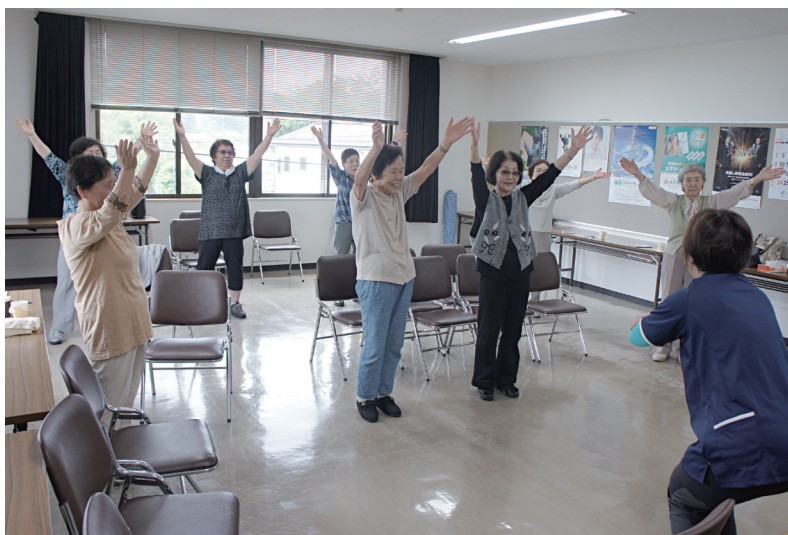
会議室で行う体を動かすサロン活動