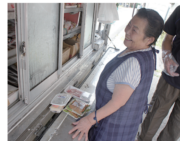
移動販売車により自宅前でも買物ができます