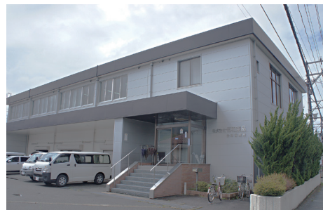
サロンの会場提供企業

もうひとつは、運動ができる場所として、町内会にある企業に会議室を借りました。出社する人が少ない土曜日に会議室を借りサロン活動を行っています。