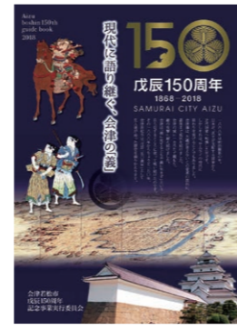
専用パンフレット