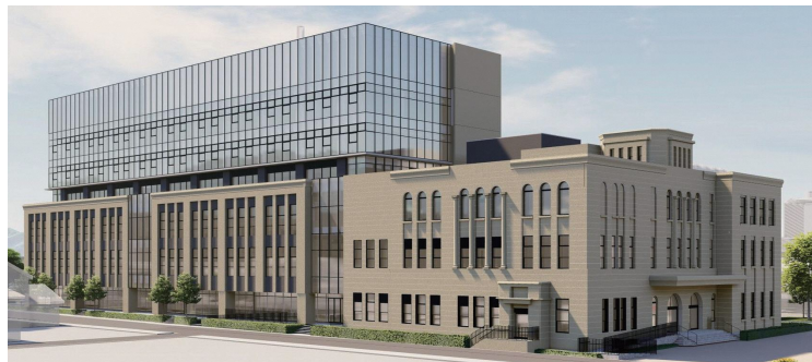
[北東側から見た、新庁舎の外観イメージ]