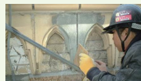
〈外壁の試験施工※の例〉