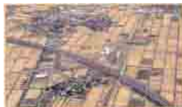
会津若松インターチェンジ