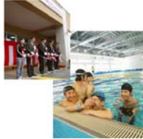
コミュニティプール⑨