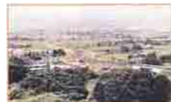
会津盆地に入る高速道路