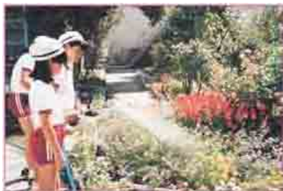
花だんに水をやる