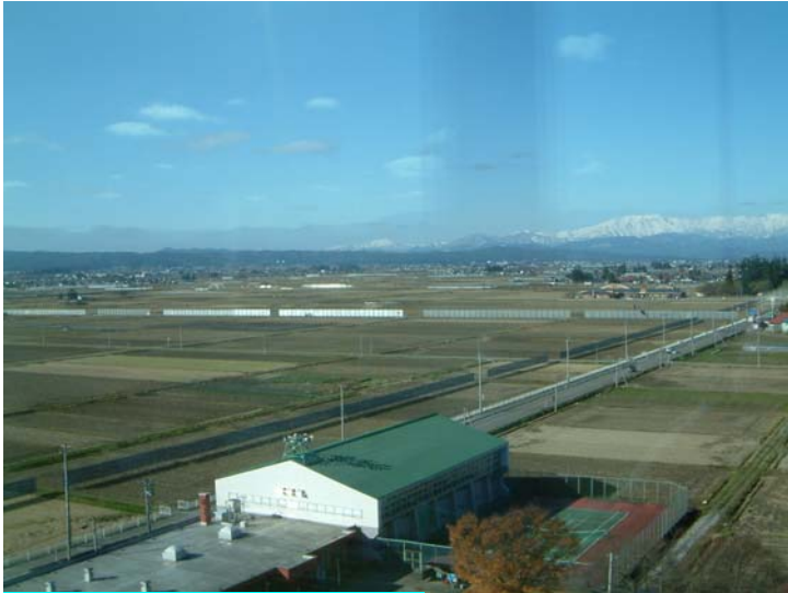
田や畑の多い所(市の北西)