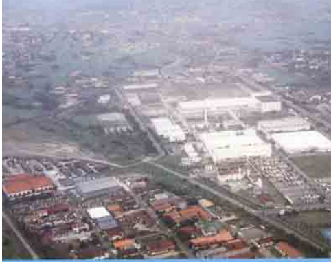
工場があつまっているところ (工業団地ふきん)