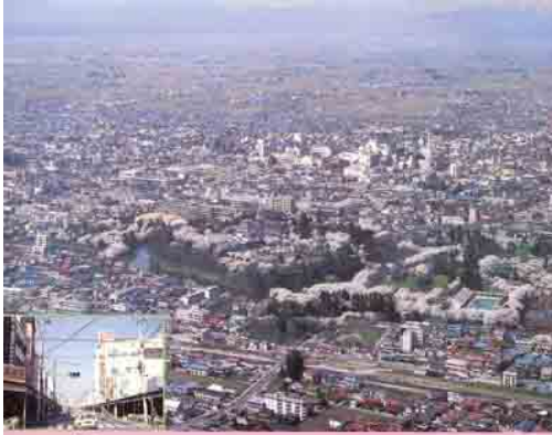
店の多いにぎやかなところ (神明通りのふきん)