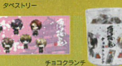
キーホルダー クリアファイル タペストリー

※画像はイメージです。実際の商品とは多少異なります。※商品は数に限りがありますので、品切れの際はご了承ください。