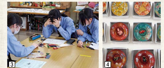
3_アイデアの実現に向けて、試行錯誤を重ねながらひとつずつ課題を解決していきました 4_地域の高校生と企業の協働によって完成した、他にはない一点ものの盃(さかずき)

葵高校美術工芸部と(株)三義漆器店は、葵ゼミの出前講座をきっかけに交流が始まりました。今まで捨てられていた会津木綿の切れ端を活用したり、自然由来の糊を開発したりと、高校生ならではの若い感性やアイデアを存分に取り入れて、会津漆器と会津木綿を掛け合わせた商品が完成しました。