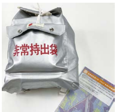
非常用持ち出し袋やハザードマップを普段から確認しておきましょう