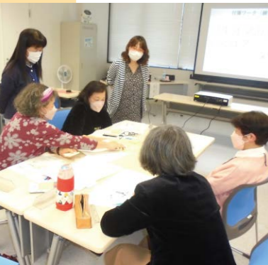
楽しみながら生涯学習を学びませんか

▼申し込み方法…所定の申込用紙に必要事項を記入の上、直接かファクス、郵送で會津稽古堂(〒965-1199)