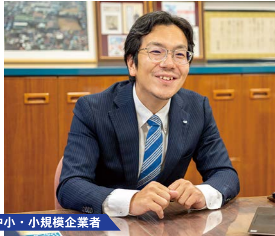
中小・小規模企業者