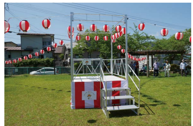
飯盛第二団地自治会で整備した櫓ステージなど