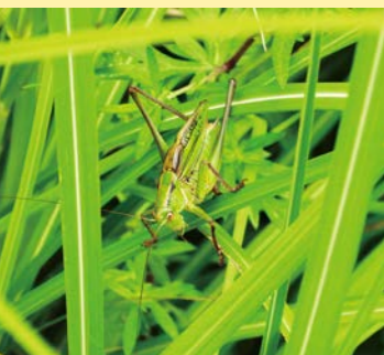
背の高い草むらなどに生息しています

「キリギリス」 キリギリスはバッタ目キリギリス科に属する昆虫です。体長は24mmから40mmほどで、体が太く、全体的に緑色もしくは褐色で、背面は濃褐色です。細長い触角があり、後肢は長く伸びていて、前肢には肢の直径よりも長いとげが並んで生えています。オスは前翅に発音器をもち、快晴のときに「ギー スチョン」と活発に鳴きます。3月から4月ごろに孵化し、夏に成虫になります。成虫の寿命は平均で2か月ほどです。雑食性で、やわらかい植物や小さな昆虫を食べます。成長するにつれて食肉性が強くなります。本州から九州まで広く分布し、市内では東山地区などで見ることが出来ます。