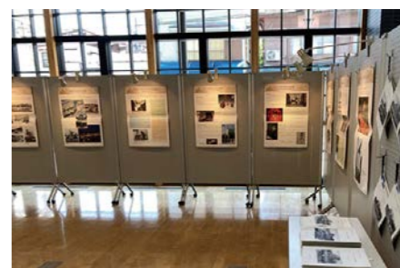
パネル展では原爆被災の実態を知ることができます