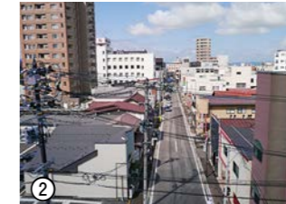
写真①と同じ角度で、令和元年に撮影された一之町通りの写真

古写真①は、1915(大正4)年頃に若松警察署(現在は常陽銀行会津支店が建つ)から西へ向かって一之町通りを撮影したものです。一之町通りは、大町札ノ辻(現・大町四ツ角)から東へ向かって馬場町通り、甲賀町通り、博労町通りと交わる通りで、安土桃山時代から商人や職人が住む町方の中心地でした。明治期に入ると市役所や郵便局などの官公庁のほか、漆器店や旅館などの商店が軒を連ねて栄えます。大正期には、第一次世界大戦による好景気もあり、大町一之町だけで5つの銀行が立ち並んだほどです。昭和期に行われた住居表示により「一之町」という町名表記自体はなくなりましたが、現在もバスの停留所などにその名を留めています。