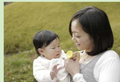
メディアを利用しない時間を大切に、豊かな時間を過ごしましょう

特に乳幼児期は、言葉が発達する大事な時期であり、この時期におけるメディアの長時間の視聴が言葉の遅れにつながるという報告があります。そのため、市では乳幼児健診で保護者の皆さんにお子さんのメディア利用時間を確認したり、日本小児科医学会発行のリーフレット「スマホに子守をさせないで」を配布したり