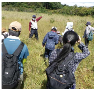
昨年度の様子です