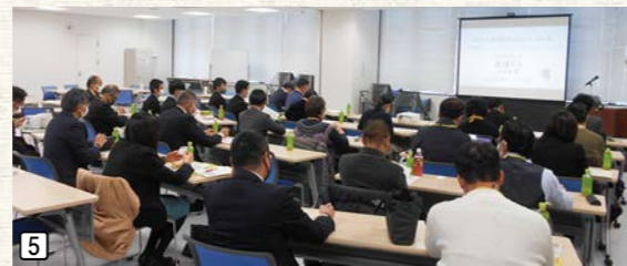
5_講演に耳を傾ける皆さん 6_昨年度は「地場産業のアップデートとゼロから始めるDX」と題し、貴重なお話を聞きました