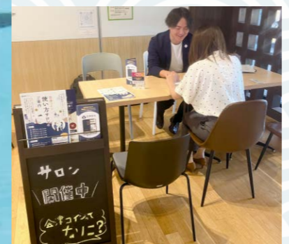
スタッフが分かりやすく説明します

「会津コイン」はスマートフォンアプリ「会津財布」を使って利用できるデジタル地域通貨です。現在、市内の一部の店舗で利用できます。今秋以降、市のプレミアムポイント事業などでの活用も予定しています。この機会に、ぜひ使ってみませんか。 「会津財布」のダウンロードから「会津コイン」の設定やチャージの方法などについて丁寧に説明します。気軽にお越しください。 ▼とき…来年3月25日(月)までの毎週月曜日、正午～午後4時※8月14日(月)、祝日、年末年始は除く。予約優先 ▼ところ…あゆむCafe(東栄町) ◆予約・問い合わせ…AICTコンソーシアムデジタルサポート窓口(☎23・7313) AICT デジタルなんでも相談所を開設しています