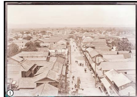
大町札ノ辻(大町四ツ角)から道が食い違って、七日町通りが続ぎ、多くの人が行き交う様子が見えます

会津図書館では貴重な所蔵資料をデジタル化して公開しています。その中から懐かしい風景などを紹介します ●問い合わせ…会津図書館(☎22-4711)