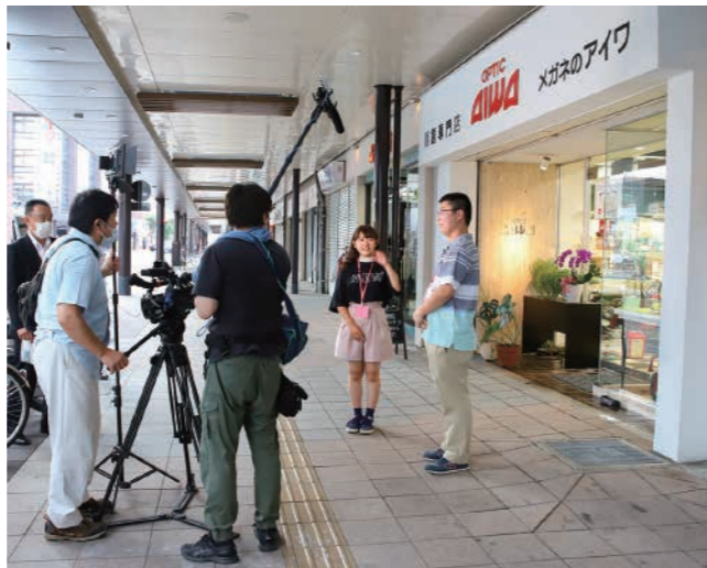
テレビ広報「あいづわかまつ情報チャンネル」で神明通り商店街の店舗を紹介しました