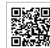
あかべこ券のホームページのQRコード

7月に市内の宿泊施設や観光施設、飲食店などで利用できるプレミアム付きの商品券「あいづ観光応援券(あかべこ券)」を販売しました。あかべこ券の利用期限は来年1月10日(日)までです。お早めにご使用ください。なお、最新の店舗情報などは「会津若松観光ナビ」内の専用ページをご覧ください。※あいづ観光応援券(あかべこ券)は既に完売しました