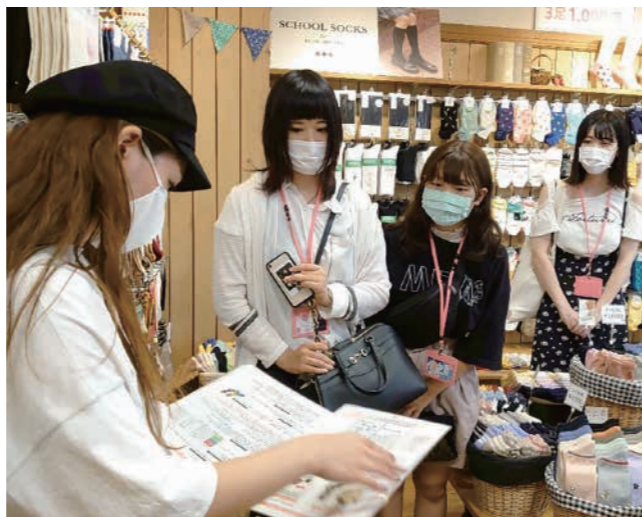
現在、靴下屋会津若松店と一緒に商品開発をしています。その打ち合わせをしました(8月31日)