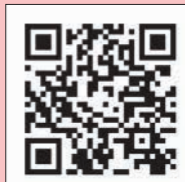
専用ホームページのQRコード

専用ホームページ ( https://www.premium-aizuwakamatsu.jp )のフォームから申し込み