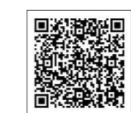
市のホームページのQRコード

◎問い合わせ…会津若松市商店街連合会(☎37-2789)、商工課(☎39-1252)