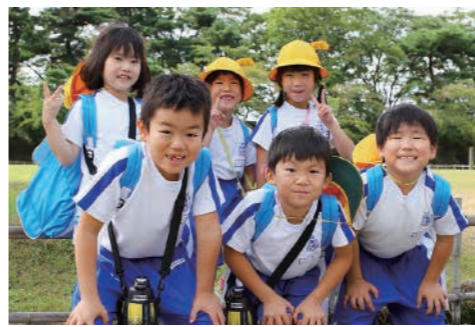
鶴城小学校の児童が遠足で鶴ヶ城に来ていました(9月28日)