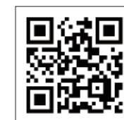
あいづ食の陣のホームページのQRコード

10月から12月のテーマ食材は、「米と酒」です。水の良さに加え、会津盆地特有の朝晩と昼の温度差が甘みのある良質な米を育てます。また、会津地域では、この風土に加え、良質な米と豊かな水源に恵まれ、古くから酒造りが行われてきました。会津清酒は、香り高く味わいが豊かなのが特徴です。あいづ食の陣に加盟する飲食店や宿泊施設など74店舗では、会津産米を使った特別メニューの提供や、米や酒の販売が行われています。メニューなどの詳細は、あいづ食の陣のホームページをご覧ください。