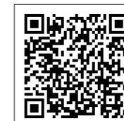
このQRコードを読み込むと友達になれます

コミュニケーションアプリ「LINE」を利用したスタンプラリーです。下のQRコードを読み込んで、LINE公式アカウント「会津酒場スタンプラリー」と友達になってから、参加店舗で3,000円以上の飲食をすると精算時に1店舗一人あたり1ポイントもらえます。3店舗分を集めると、3,000円分のお食事クーポンがLINEで届きます。また、タクシー割引クーポンや会津清酒で乾杯キャンペーンも実施中ですので、ご利用ください。