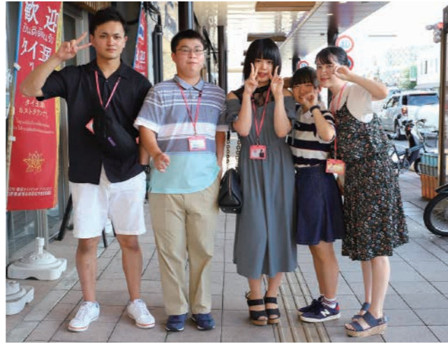
学生PR部「AiZ'Sモーション」二期生