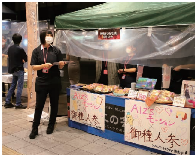
9月19日・20日、酔市で、会津産オタネニンジンを使ったシフォンケーキを販売しました(神明通り商店街振興組合と共同開発)