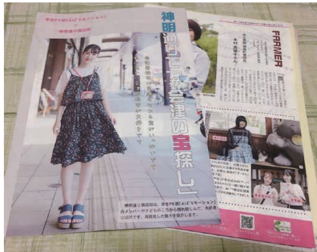
市政だより9月1日号と一緒に、神明通り商店街取材して作ったパンフレットを配布しました