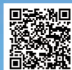
市のホームページのQRコード

市や県の事業に参加している飲食店などの情報をまとめました。 事業の詳細や最新情報は市のホームページをご覧ください。