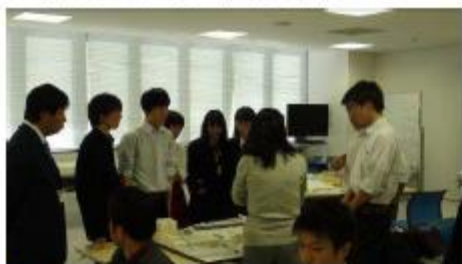
◆ 現況模型を前に作戦会議