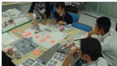
◆ 駅前まちづくりのコンセプトを練る