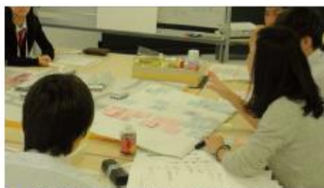
◆ 会津若松のいいところを考えてみる