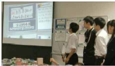
◆グループで考えたコンセプトの発表