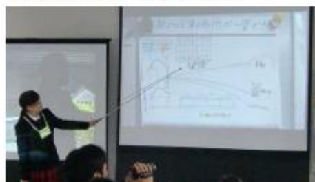
◆図解でまちの立体構造を解く