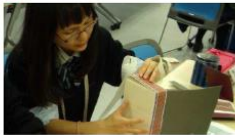
◆ ボリューム模型に建物ファサードを貼る