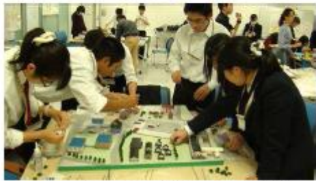
◆ ディテールに気を配り総がかりの作業