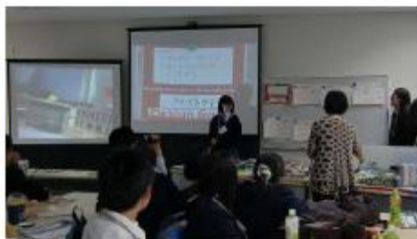
◆模型映像でディテールを説明