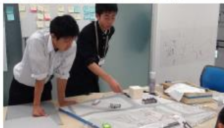
◆ 基盤模型にシートを重ねて設計する