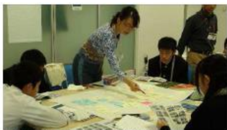
◆ 地図を広げて駅の位置を確認