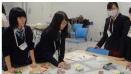
◆ 模型を置いてイメージを積み上げる