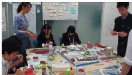
◆ 会津カラーの赤煉瓦色で街並みを統一