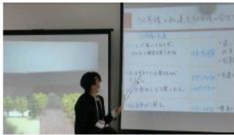
◆まちづくりの基本はマーケティング