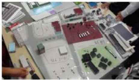
◆ 設計図の上に建物模型を並べてみる