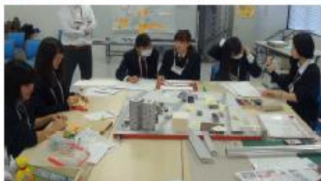
◆ コンセプトからキャッチコピーを作る