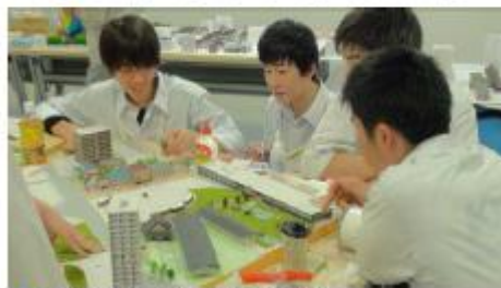
◆ 出来栄を左右する植栽