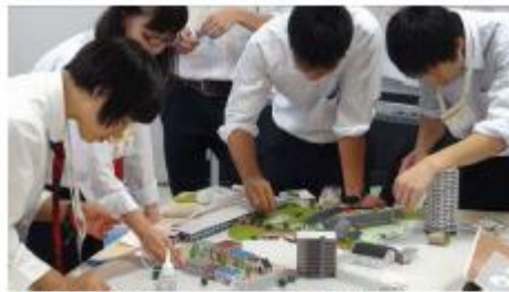
◆ 芝生広場の緑でまちの姿が見えてくる