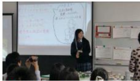
◆挿絵も入れ聴衆のイメージを膨らませる