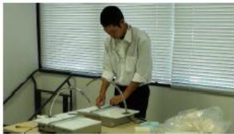
◆ スタイロフォームをカットして建物を作る