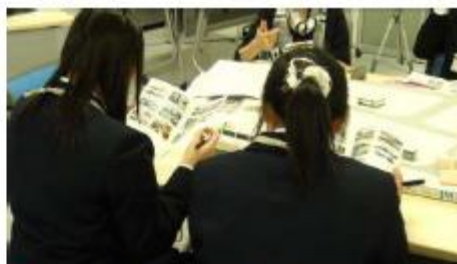
◆ 事例も参考にまちづくりのネタを探す