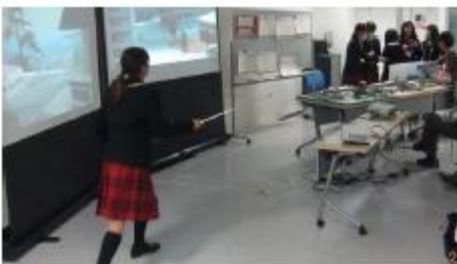
◆押し出しのよい迫力のプレゼン