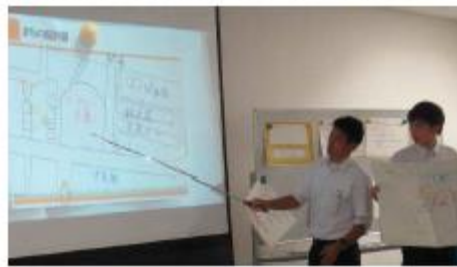
◆駅前広場を中心に拡がるまち