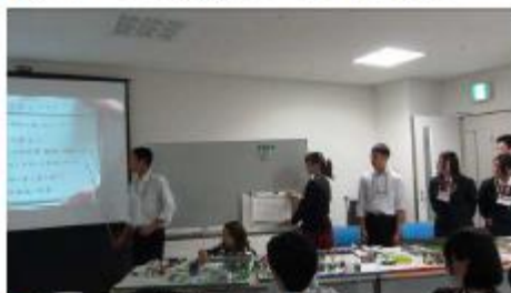
◆街区ごとの機能分担を解説