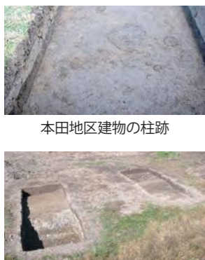
本田地区建物の柱跡

北会津町の本田地区で農地整備が計画されており、その範囲に埋蔵文化財が存在することから、事前に試掘調査を行い、正確な遺跡の範囲や内容を確認しました。 調査の対象となる範囲は二か所あり、そのうち一か所は、「二盃館跡」です。江戸時代に編纂された『新