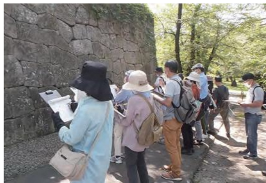
石垣を見ながら、特徴をスケッチして学びます!

歴史資料センターまなべこでは、郷土の歴史や文化について学ぶ歴史文化講座を開催しています。 昨年は、神指城や、陣が峯城、向羽黒山城、柏木城といった、若松城以外の会津のお城についての講座や、大河ドラマで話題になった鎌倉時代の始まりについての屋内講座などを開催しました。 また、実際にお城の中を