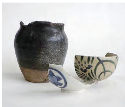
発掘調査で出土した陶磁器

現在、庁舎の建て替え工事を進めている市役所本庁舎の周辺は、江戸時代には上級武士の家屋敷が立ち並んでいた場所です。新しい庁舎を建てる際に土の中に残る遺跡を保存できない範囲について、令和4年の7月から12月にかけて発掘調査を行いました。 調査では、武家屋敷で使用されていたと見られる食器などの陶磁器や、お箸や下駄といった木製品、古銭や煙管の部品などの金属製品も出土しました。 他にも、石組みの井戸跡や、池の跡、屋敷の境目を区画していたとみられる大きな溝など、武家屋敷の痕跡を確認しました。 今回の発掘調査の全体の成果については、令和5年度に歴史資料センターまなべこで展示します。実際に遺跡から出土した資料も展示する予定です。ぜひ足をお運びください。