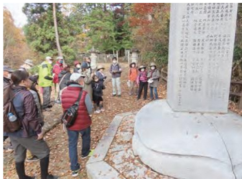
紅葉と併せての散策もいいですね!

市では毎年、御廟の森を散策しながら墓所や会津藩の歴史について学ぶ散策会を開催しています。今年度で14回目となり、令和4年11月13日に開催しました。今年も、①墓所の見方を学ぶ初心者向け、②歴史について