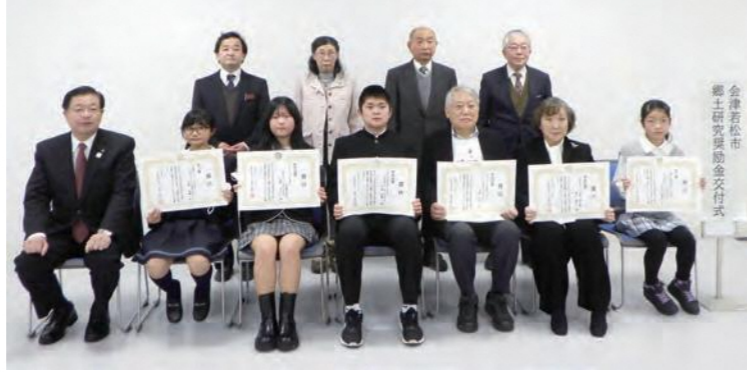
郷土研究奨励金交付式記念撮影

今後も歴史や文化財などに関する講座や散策会、郷土研究奨励事業などを実施する予定です。随時市政だよりや市ホームページでお知らせします。