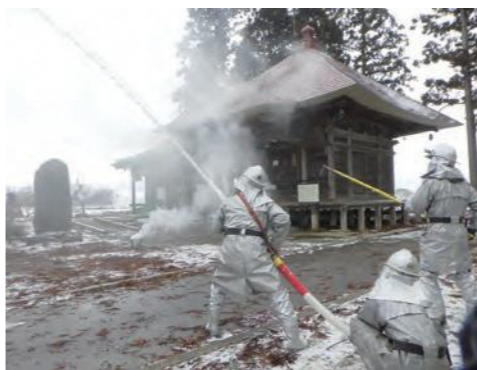
防ぎよ訓練の様子

1月22日に、北会津町下荒井地内にある市指定文化財「下荒井観音堂」において訓練が実施されました。観音堂からの出火を想定し、町内会役員による通報・初期消火訓練、会津若松市消防団第14・15・16分団、会津若松消防署による中継送水や放水訓練など、本番さながらの訓練が行われました。 文化財は、かけがえのない「地域の宝」であり、後世に残していくには、文化財所有者はもちろんのこと地域全体での防災意識の高まりが重要となりますので、ご協力をお願いします。