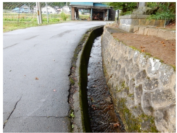
ため池より下流に続く水路状況