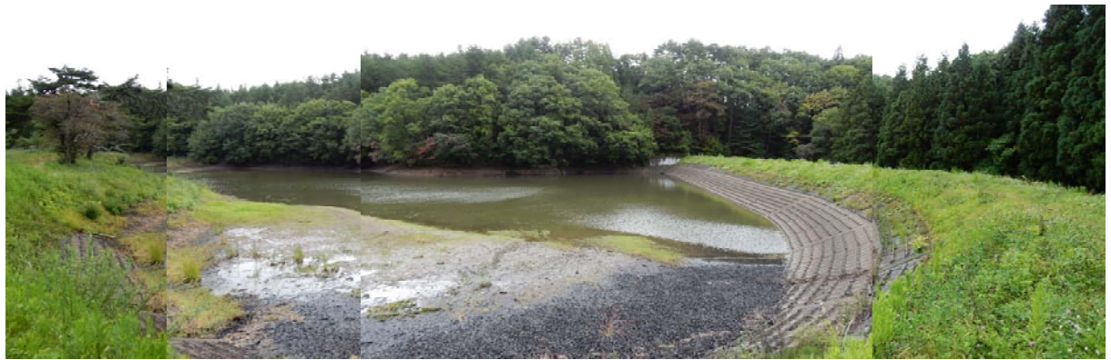
北山ため池の全景