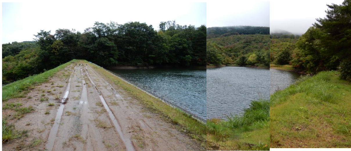
赤井ため池の全景