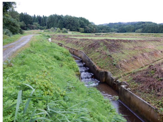
ため池より下流の水路（階段工）