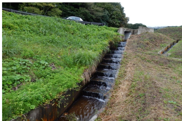
ため池より下流の水路（階段工）