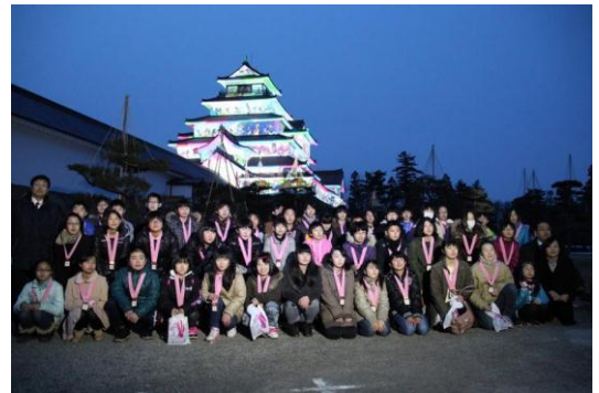
表彰式の様子（2014年3月）

入選された皆様には、住まいと暮らしの総合住生活企業の株式会社LIXILより、10年たっても色あせないフォトタイルで制作する「鶴ヶ城プロジェクトマップ はるか2015」オリジナルメダルを贈呈させて頂くと共に、福島民報朝刊（2015年3月下旬予定）に掲載させて頂きます。また、2015年3月18日（予定、イベント前日）に会津若松市 鶴ヶ城で行う表彰式（入選作品も上映）をご案内致します。