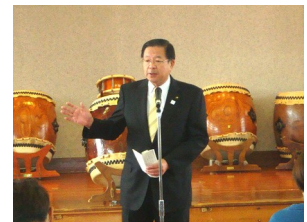
祝辞を述べる市長

開会式終了後、荒館小学校和太鼓クラブの元気な演奏で舞台発表がスタート。7団体の皆さんが、日頃の練習の成果を披露してくださいました。