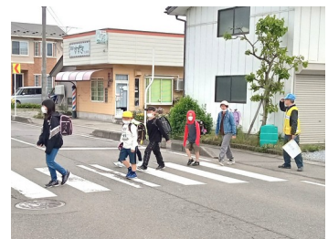
昭和公園わきの様子