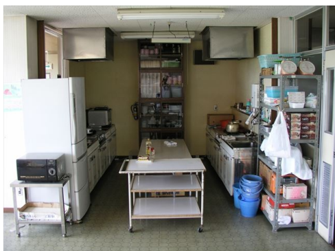
○調理室 調理器具等