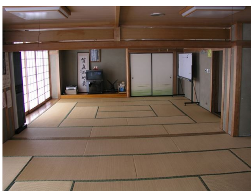
○日本間 1・2 前方