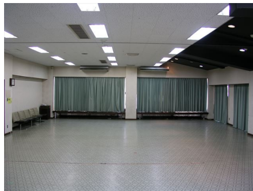
○会議室 1・2 後方