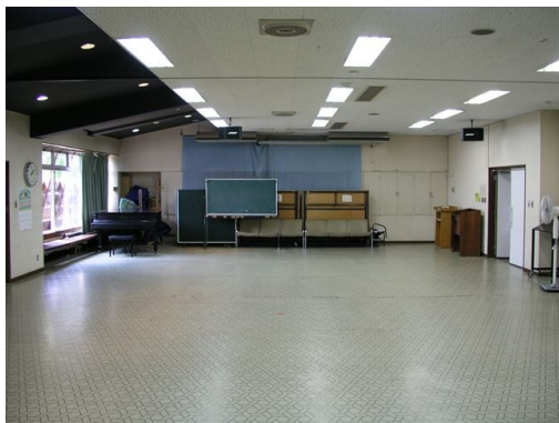
○会議室 1・2 前方